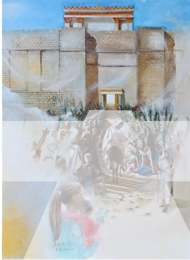
Croix de joie