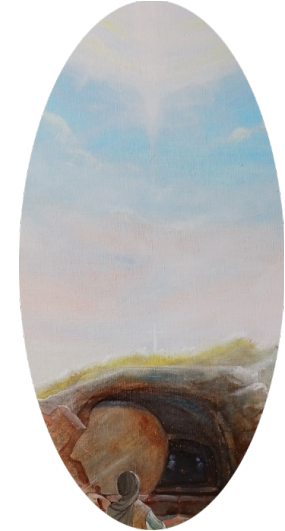
Porte de la Vie éternelle et pierre roulée