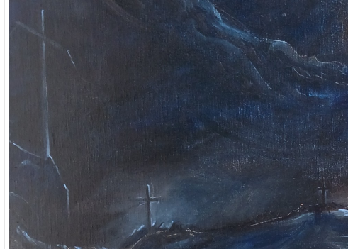
Croix de mort (comme dans nos cimetières)