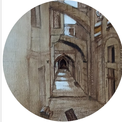
Porte sans issue