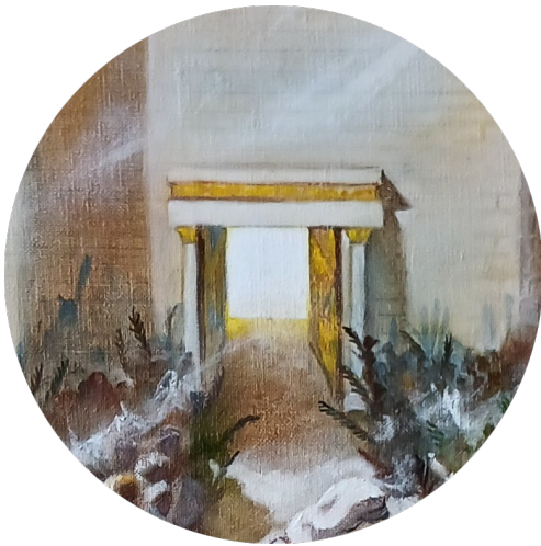
Porte de la Vie éternelle ou Porte Dorée