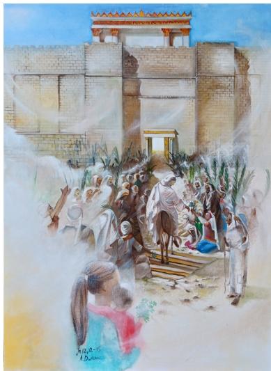
Hosanna ! (Jean 12, 12-15)