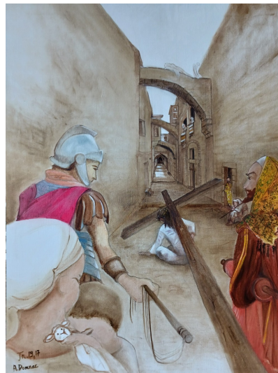
Chemin de croix (Jean 19, 17)