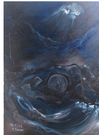
Jésus au tombeau (Marc 15, 46)