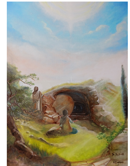
Résurrection de Jésus-Christ (Jean 20, 11-12)